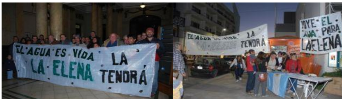
Figura 2: Expresiones del conflicto en fotos

“a la población en general que no vaya a tirar basura por allá, porque bastante tenemos con la falta de recolectores. Todos los lunes o domingos a la mañana nos encontramos con bolsas de pasto o de residuos de rotiserías, algunas incluso sobre la ruta”.