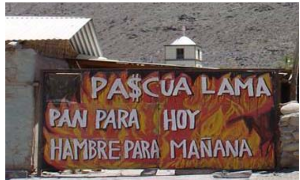
Figura 3. Mural en Alto del Carmen, diciembre del 2006

el marco indigenista, la mención a los derechos territoriales de los Diaguitas es continua. En el tradicionalista, las críticas a la privatización, a las políticas de inversión extranjera y a la insostenibilidad laboral de la minería también. Por tanto, vemos como este no es un caso puro con un único nivel de abstracción: se entrelazan reivindicaciones materiales, la defensa ancestral de un modo de vida agrícola y discursos ambientalistas. La oposición tiene reivindicaciones heterogéneas y los marcos interpretativos construidos entorno a ella (indigenista y tradicionalista) son la cristalización de esa complejidad.