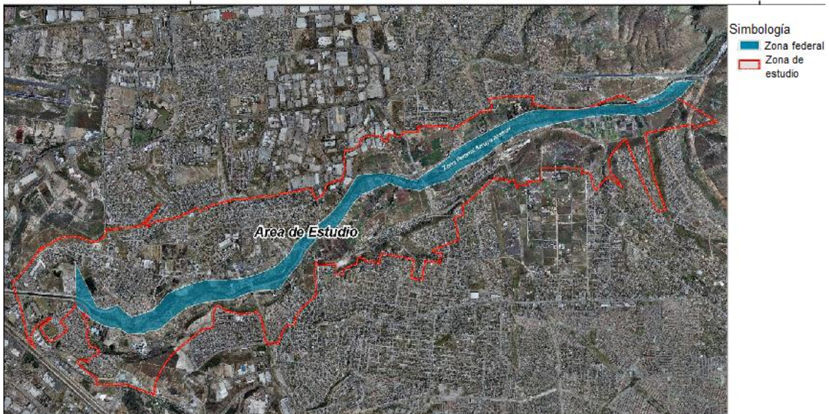
1: localización de zona de estudio