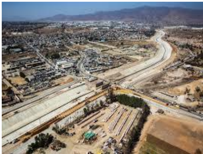
Figura 4: Canalización del arroyo Alamar.