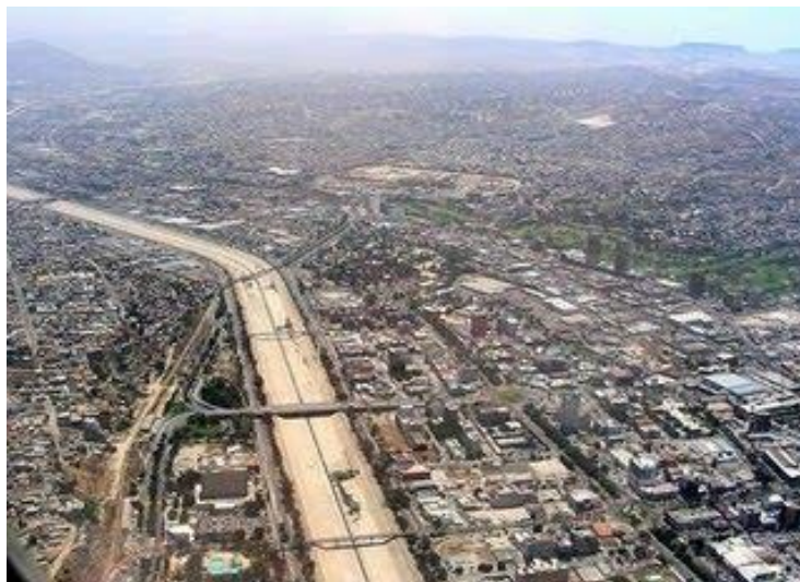
Figura 3: Canalización río Tijuana.Figura

persona (Martínez 2005). No obstante lo ya señalado y la importancia de la pérdida ambiental que supone la construcción de la canalización, no es este el único ámbito en el que resulta perjudicada la ciudad, la afectación urbana y social es más amplia y relevante: sí la canalización del Río Tijuana ya dividió a la ciudad en dos partes (ver figuras N° 3 y N° 4).